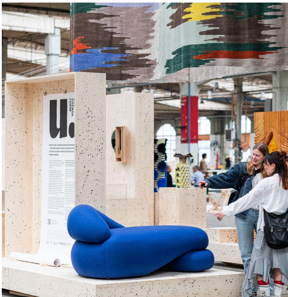
UNG SVENSK FORM 2024, SOUTHERN SWEDEN DESIGN DAYS, MALMÖ.