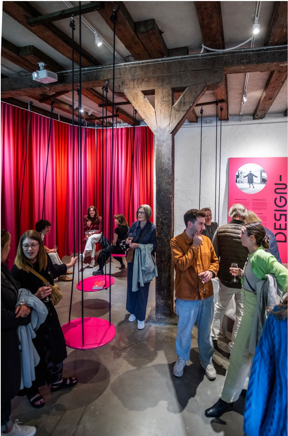
INVIGNING AV UTSTÄLLNINGEN 'DESIGNAKTIVISTEN' UNDER 60-ÅRS JUBILEET