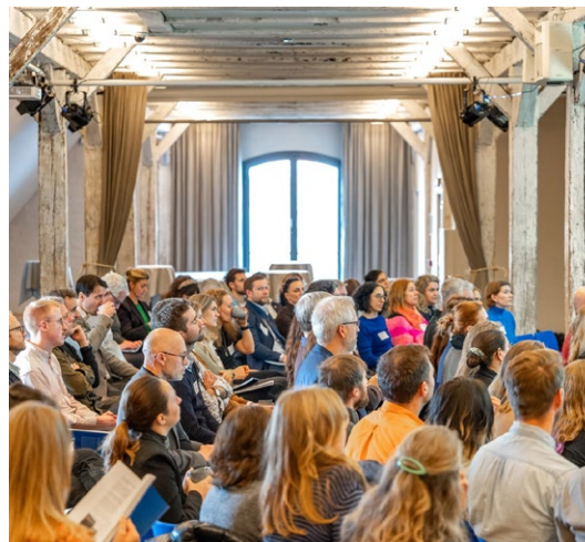
NORDIC SUSTAINABLE CONSTRUCTION SLUTKONFERENS

Under våren genomfördes en intervju-baserad studie tillsammans med experter från hela Norden för att bygga ut