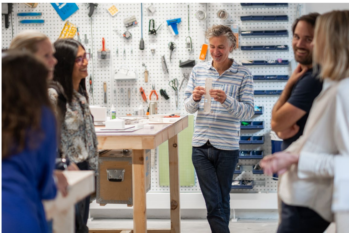
OPEN ARCHITECTURE STUDIO 2024

Bevaring, bryn space, C.F. Møller Architects, Chroma Arkitekter, DANIEL BERG ARKITEKTER, FOJAB, For Elize, Krook och Tjäder, Liljewall, LINK Arkitektur, MAKET, Malmö Stadsbyggnadskontor, MARELD, Neuhauser Arkitektur, Open Studio, Radar Arkitektur, Restaurera, Siegel Group, STADSTUDIO, STRECK, Svefors Arkitekter, Sydväst arkitektur och landskap, Växtvärdet, White Arkitekter, Wingårdhs