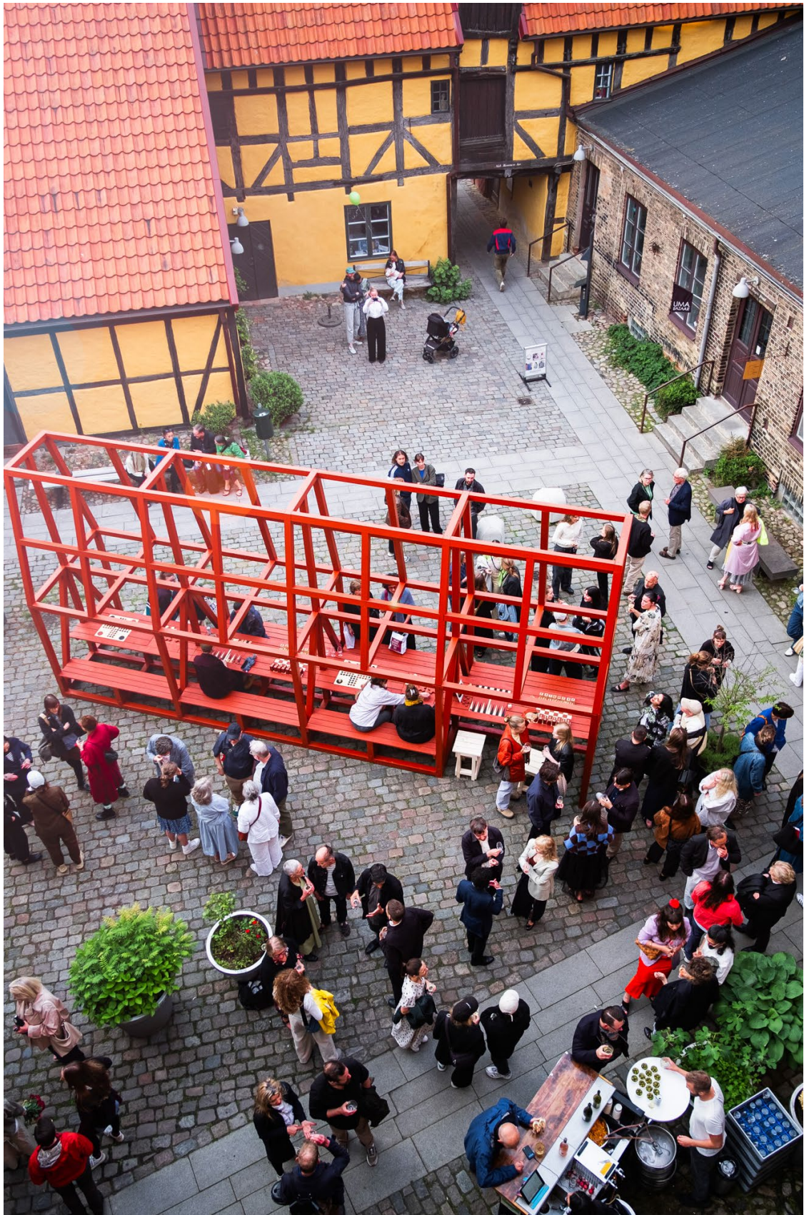
MINGEL PÅ HEDMANSKA GÅRDEN UNDER 60-ÅRS JUBILEUMSFEST