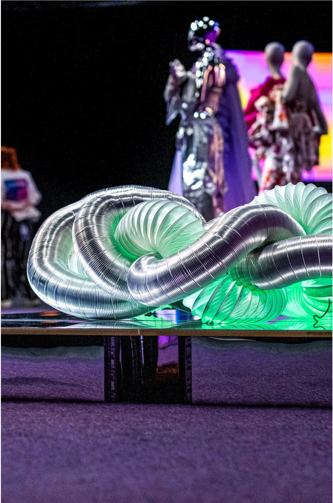
PRE-SSDD PÅ EUROVISION SONG CONTEST 2024