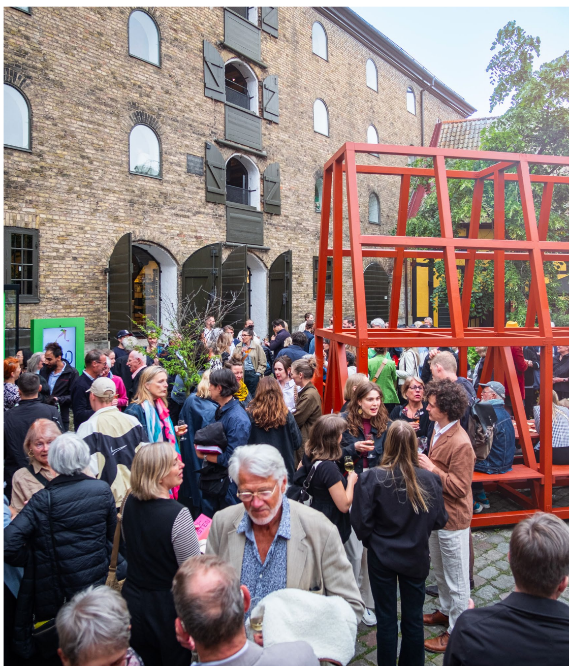
60-ÅRS JUBILEUMSFEST OCH BOKSLÄPP

Tillsammans med samarbetspartners erbjöds ett brett utbud av programaktiviteter som föreläsningar, seminarier och workshops, på Form/Design Center och utanför huset, digitalt som fysiskt. Mötesplatsen användes även av en rad organisationer, akademi, offentlig sektor och branschaktörer för möten och sammankomster. Totalt genomfördes 63 publika arrangemang under 2024. Här är ett urval: