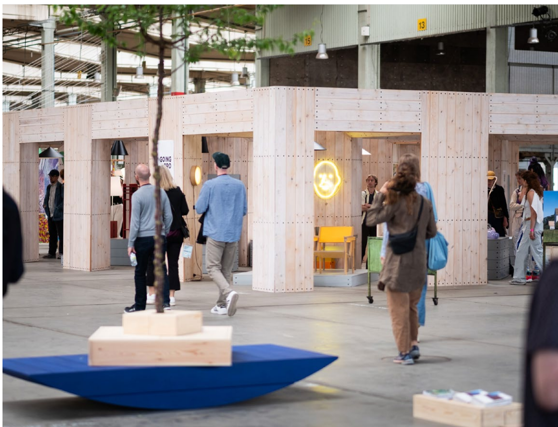
DELTAGARNA I GOING PRO VISADE UPP SINA ARBETEN I EN UTSTÄLLNING PÅ MAIN LOCATION UNDER SOUTHERN SWEDEN DESIGN DAYS

GOING PRO är ett affärsutvecklingsprogram för designers, specifikt inriktat mot enskilda utövare, designstudios och mindre företag verksamma i Skåne. Programmet är ett samarbete mellan Form/Design Center och Almi. I GOING PRO får en grupp motiverade designers möjlighet att ta nästa steg i sitt kreativa entreprenörskap – att utveckla sitt företagande, bli mer professionella som leverantörer och öka sin konkurrenskraft. Under våren 2024 medverkade tio deltagare i ett program med coaching inom affärsutveckling, strategi, ekonomi, avtal m.m. Programmet avslutades med en grupputställning under Southern Sweden Design Days. Hösten 2024 drog femte upplagan av programmet igång och genom en open call valdes tio nya deltagare ut för medverkan i 2025 års upplaga.