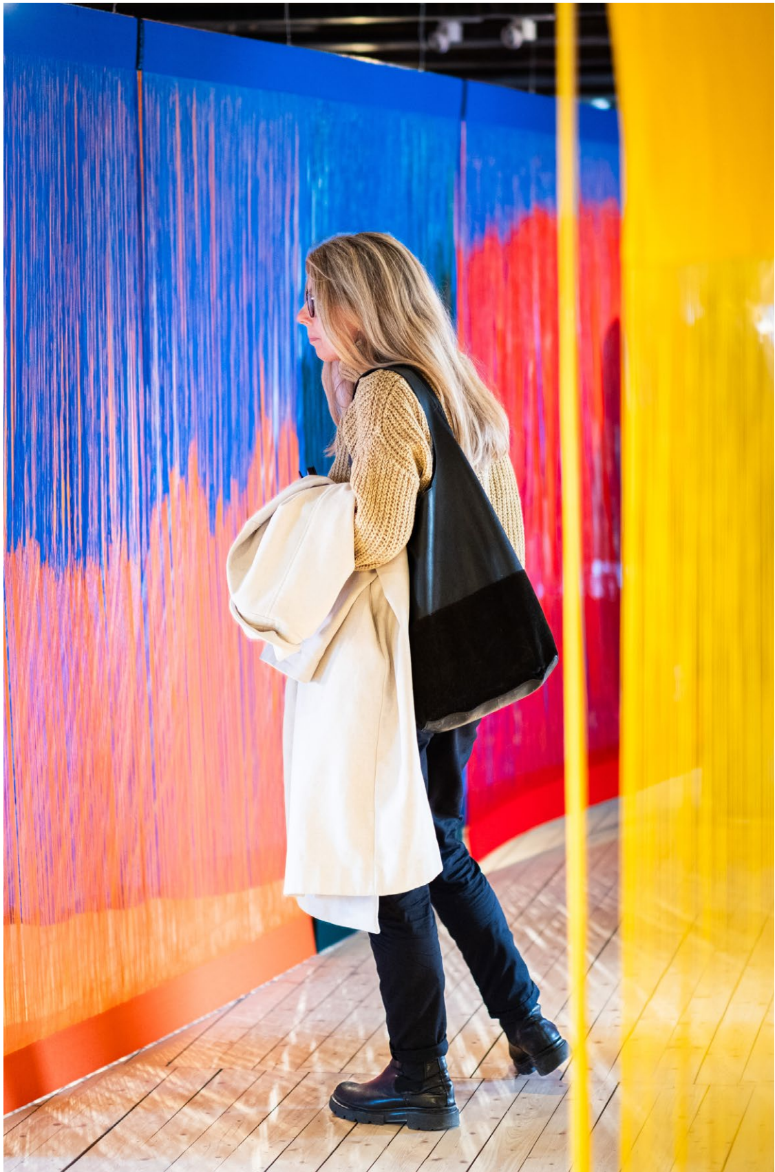
UTSTÄLLNINGEN MONUMENTAL KNIT