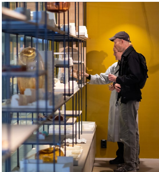
OPEN ARCHITECTURE STUDIO