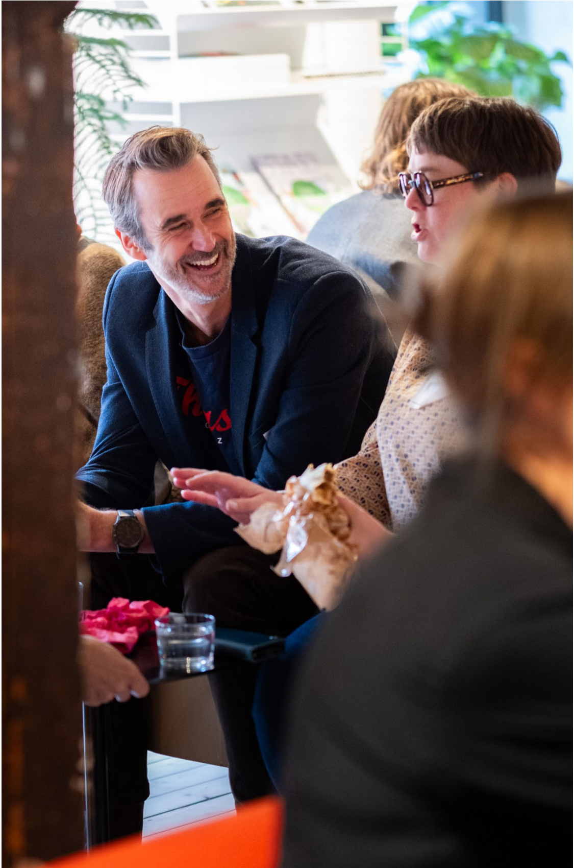
KONFERENS: PLACE AND NATURE BASED ARCHITECTURE IN THE NORDICS