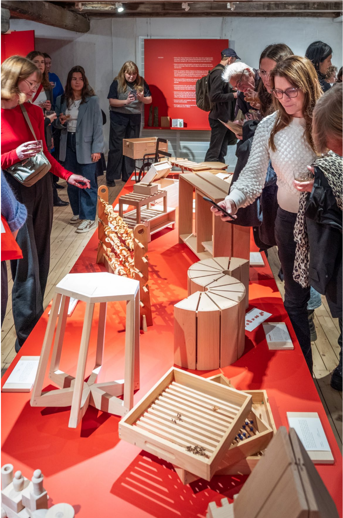
VERNISAGE: PRO BOK