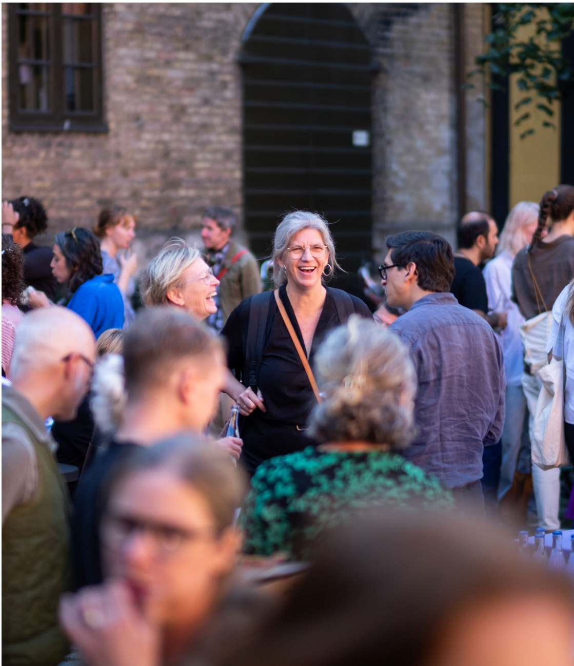
MINDEL PÅ HEDMANSKA GÅRDEN UNDER ARKITEKTURDAGEN 2023.

Form/Design Center fokuserar löpande på att skapa nya möjligheter för professionella utövare. I samverkan med olika aktörer har Form/Design Center initierat en rad plattformar och projekt för att stärka och synliggöra de kulturella och kreativa näringarna. Målet är att främja samarbete, utveckling och hållbar tillväxt regionalt, nationellt och internationellt.