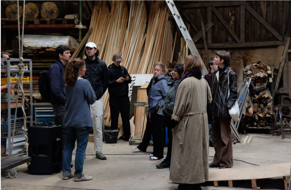
SCHOOL OF REPAIR #1: WORKING WITH THE EXISTING