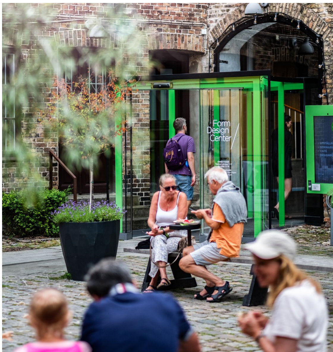
FORM/DESIGN CENTER BELÄGEN PÅ HEDMANSKA GÅRDEN, VID LILLA TORG I MALMÖ

Form/Design Center är utsedd av regeringen som nationell nod för gestaltad livsmiljö och är officiell partner i New European Bauhaus. Form/Design Center startades 1964 som en ideell förening och drivs idag med stöd av Kulturdepartementet, Malmö stad, Region Skåne och Statens kulturråd.