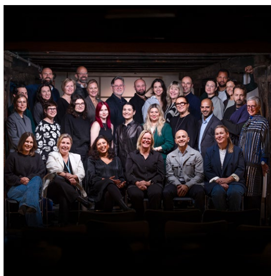
DELTAGARE VID URBAN ACADEMY: SIGNERINGSEVENT