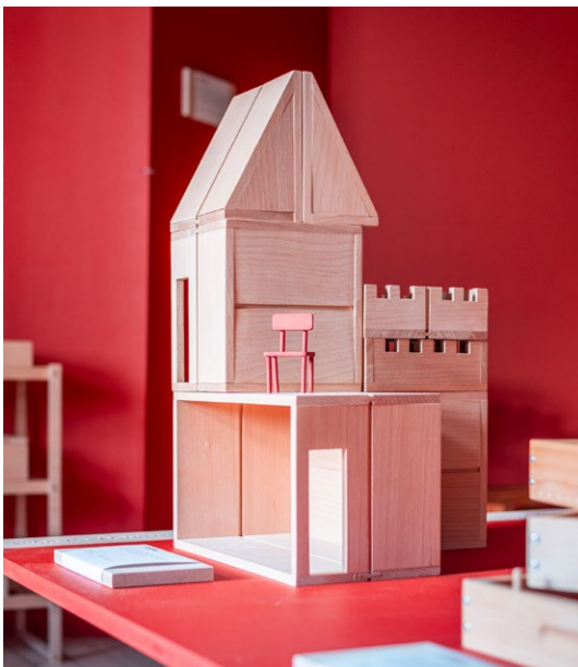
UTSTÄLLNINGEN PRO BOK

När det gäller verksamhetens strategiska prioriteringar som vi gjort under året vill jag särskilt uppmärksamma några satsningar: