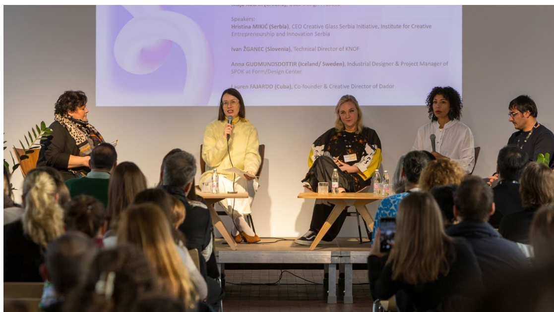
SPOK MEDVERKAN I PANEL PÅ KONFERENS I LJUBLJANA, SOLVENIEN.

Utöver detta har flertalet föreläsningar, studieresor och utlysningar arrangeras under året i flera av SPOKs hubbar.