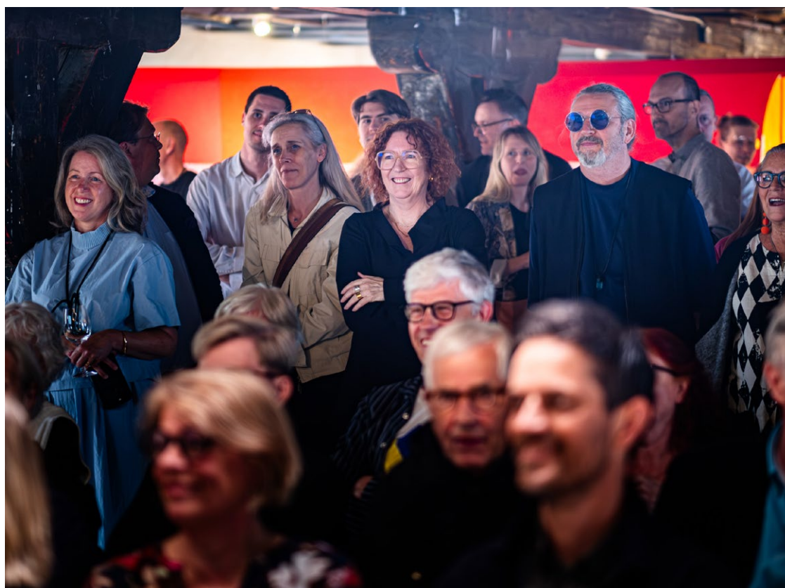
INVIGNINGEN AV 60-ÅRS JUBILEET