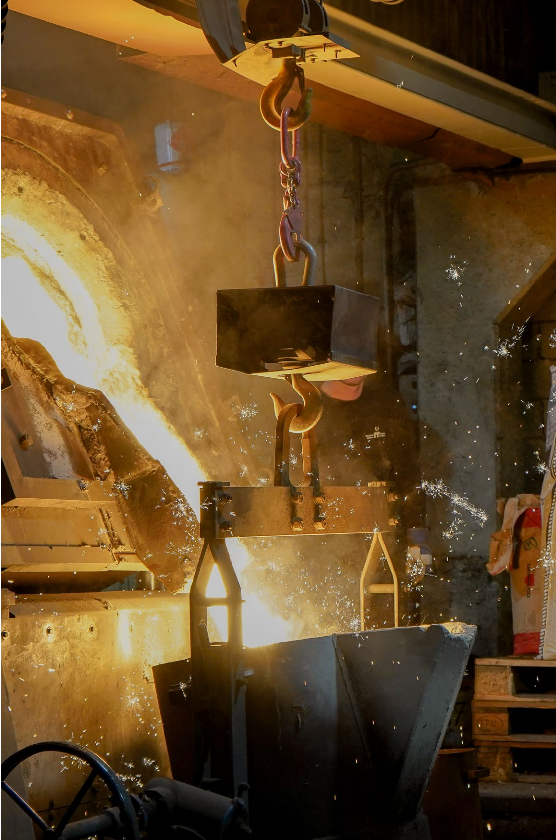
FRÅN PRODUKTIONEN AV SAMARBETET NEW ORDER ARKITEKTUR + MÖLLTORPS GJUTERI, TILL UTSTÄLLNINGEN DES&DOI.