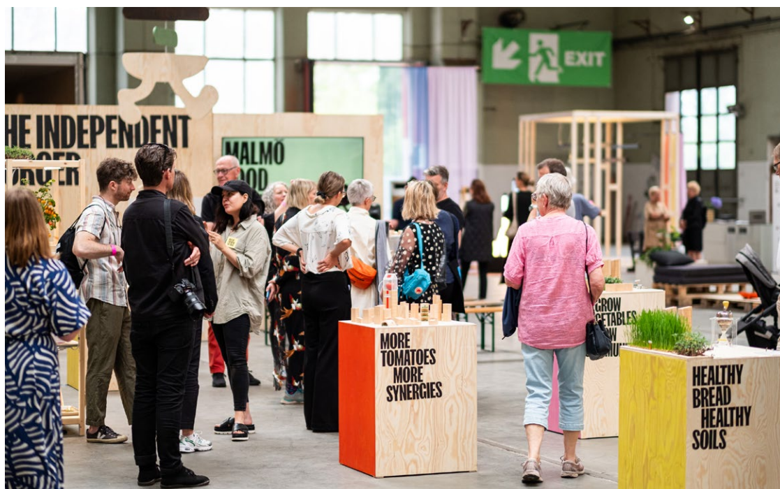
OBEROENDE MATSTADEN, MAIN LOCATION, SOUTHERN SWEDEN DESIGN DAYS 2024

PAMPAS var en av deltagarna i Southern Sweden Design Days och en del av grupputställningen under Eurovision. Den schweiziska artisten Nemo upptäckte PAMPAS i utställningen under Eurovision-veckan och