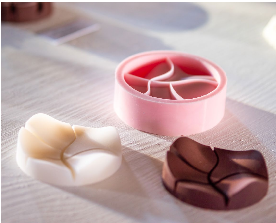
CHOCOLATE 2.0 - FRÅN DESIGN TILL PRODUKTION

Studenter på Industridesignskolan vid LTH, Lunds universitet.