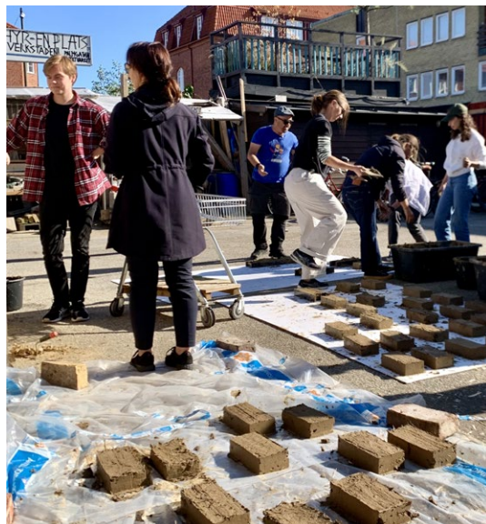
SCHOOL OF REPAIR #2: TOWARDS A REPARATIVE MATERIAL PRACTICE

Hur värderar vi bostäderna från efterkrigstiden jämfört med det som byggs i dag? Hur rutar och vårdar vi våra boendemiljöer inför framtiden? Under seminariet fick deltagare lyssna på tre olika perspektiv på boendemiljön värde, kvalitet och potential tillsammans med aktuella forskare och arkitekter.